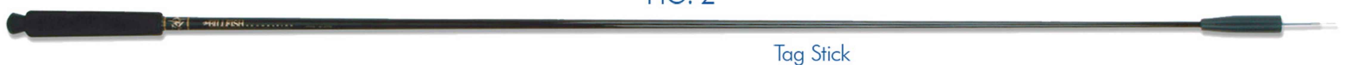
Tag Stick Head