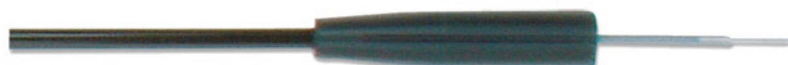
Stainless Steel Applicator